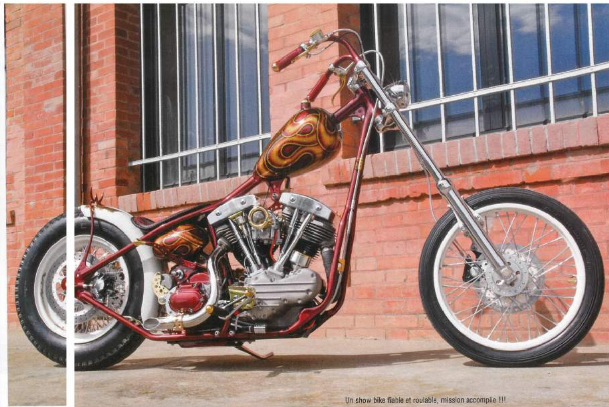
Un show bike fiable et roulable, mission accomplie !!!