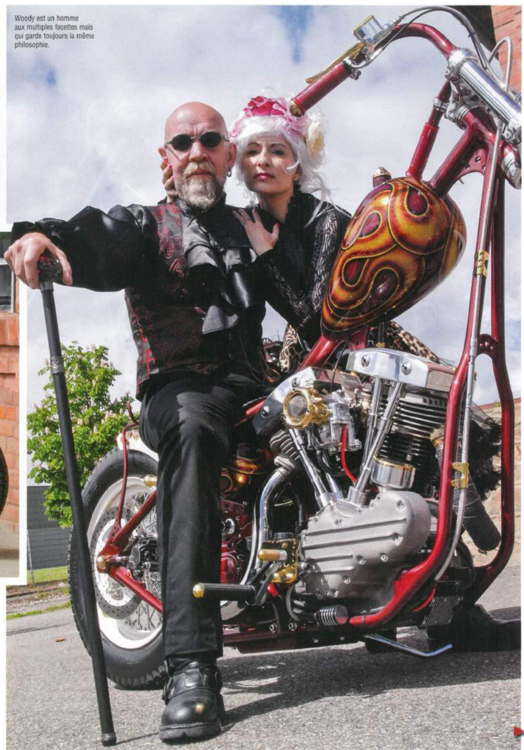
Woody est un homme aux multiples facettes mais qui garde toujours la même philosophie.

W oody fait partie des pionniers du custom en France. Il a su traverser les époques et évoluer dans sa passion, pendant que d'autres disparaissaient ou stagnaient dans un art qu'ils pensaient maîtriser. La raison majeure de cette réussite ne tient qu'au fait que Woody est un artiste qui n'est intéressé que par la création et la mise en forme des motos qui lui gangrèment le cerveau. Son besoin de créer est tel que