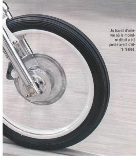
Un travail d'orfèvre où le moindre détail a été pensé avant d'être réalisé.

Fermez les yeux et imaginez nos routes de France peuplées de choppers de cette classe. Ça aurait de la gueule non ?