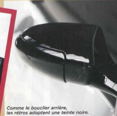
Comme le bouclier arrière, les rétros adoptent une teinte noire.