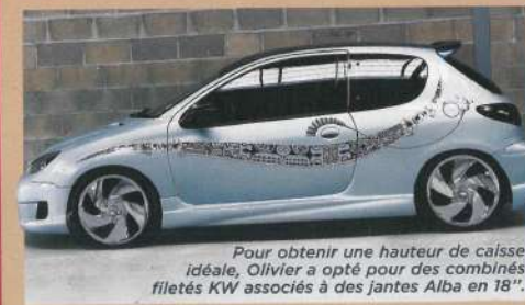
Pour obtenir une hauteur de caisse idéale, Olivier a opté pour des combinés filetés KW associés à des jantes Alba en 18".

Réalisé par Tamo, le tatoueur marquisien est un véritable art graphique. Voici les différentes étapes, depuis le dessin, en passant par la peinture des liserés, jusqu'à la pose des feuilles d'argent bouchonnées au velours... Superbe !