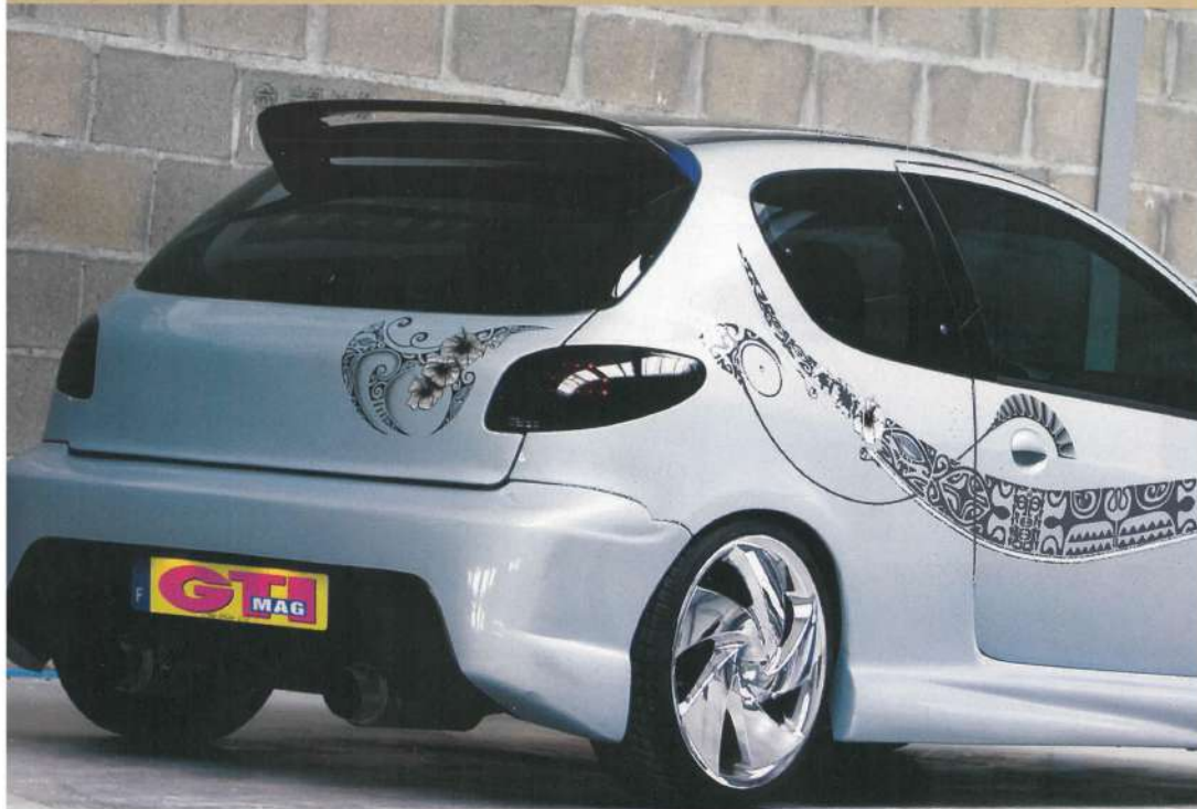
Le kit Vision MTK est ici parfaitement mis en valeur, des bas de caisse jusqu'aux boucliers. Notez l'échappement duplex sur mesure.

Quelle fut ta première voiture ? Une Clio première génération.