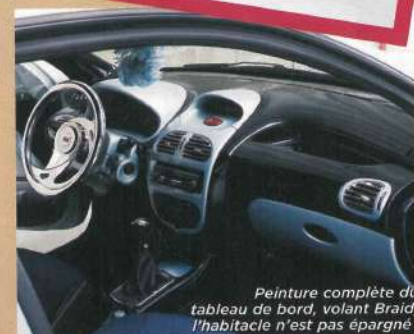
Peinture complète du tableau de bord, volant Braid, l'habitacle n'est pas épargné!